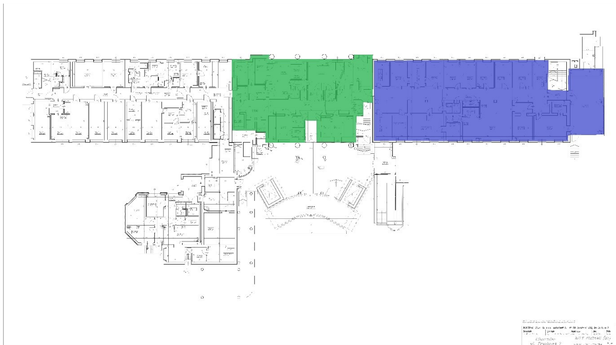
Schemat nr – Powierzchnie dołączane do SOR po istniejących poradniach (kolor niebieski), Obszar modernizacji i doposażenia pracowni diagnostycznych (kolor zielony).