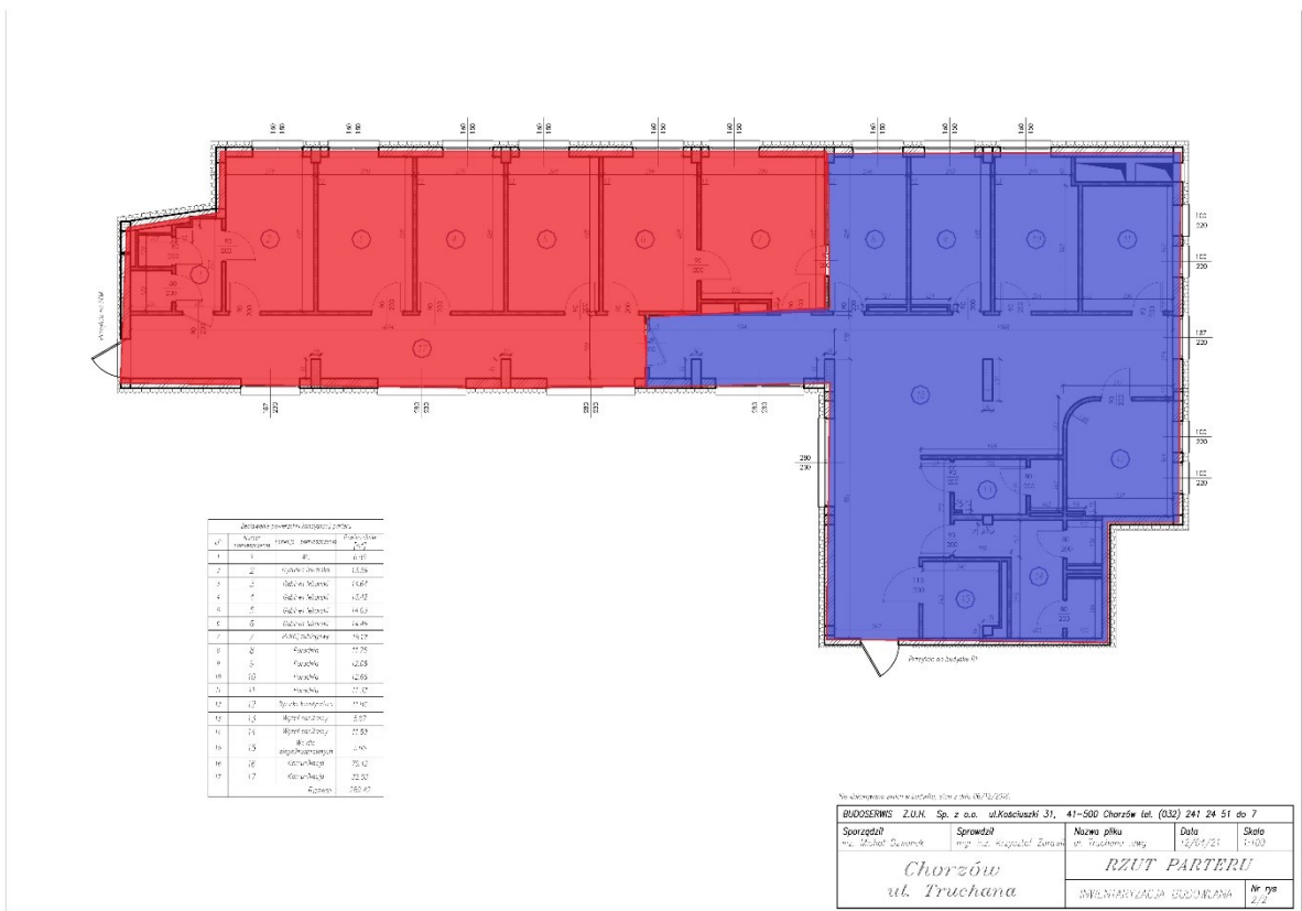
Schemat nr 2 – Istniejący obszar SOR objęty przebudową (kolor czerwony), Powierzchnie dołączone do SOR po istniejących poradniach (kolor niebieski)